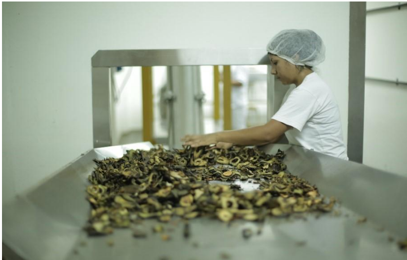
Séchage et tri des avocats entiers à Lima, au Pérou.

« Science & conscience, naturellement », telle est la philosophie de l'activité Actifs Cosmétiques d'Expanscience. Forts de 40 années d'expérience dans le domaine des matières premières végétales, Expanscience développe, dans le respect de l'Homme et de son environnement, des actifs cosmétiques naturels innovants et de haute qualité grâce à un savoir-faire en matière de lipochimie, de distillation moléculaire et d'extraction végétale. Cette démarche responsable est reconnue par la certification B Corp d'Expanscience depuis 2018 et par l'UEBT (Union for Ethical BioTrade) dont l'entreprise est membre depuis 2011.